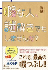
『暇な人、謎解きでもしませんか？』 暇謎 (著) / 幻冬舎