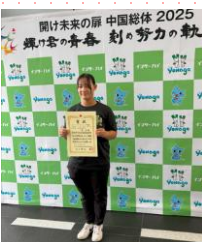
☆ウェイトリフティング競技☆